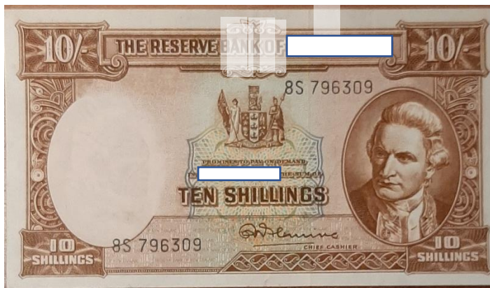
а) лицевая сторона

4. Рассмотрите внимательно изображение, представленное на рис.1, и прочитайте приведенный ниже текст.