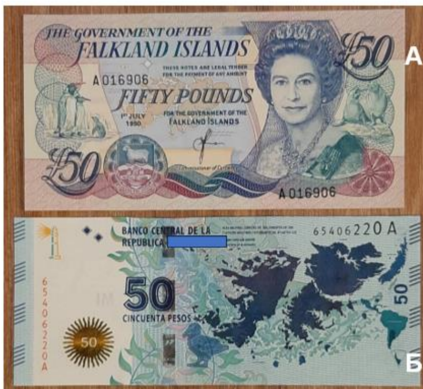
Рисунок 1 - Денежные знаки, посвященные Фолклендским островам

1. Рассмотрите денежные знаки, представленные на рисунке 1. На обеих купюрах изображены Фолклендские острова, права на которые оспаривает два государства, находящиеся в разных частях света. Извлеките из изображения купюр географическую информацию